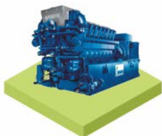
Когенераційна установка – обладнання, призначене для виробництва електричної і теплової енергії шляхом спалювання біогазу