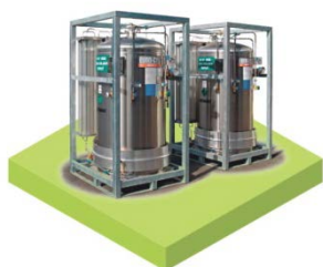
Газификатор – устройство для газификации биомассы