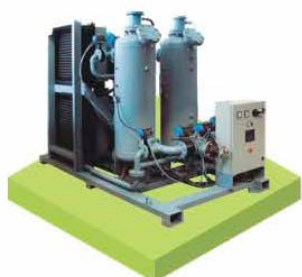
Оборудование для фильтрации или очистки газов – очистка газов от паробразных и газообразных примесей